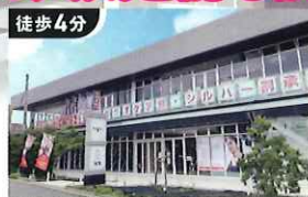
徒歩4分 アイススポーツ折尾店(フィットネススポーツジム)