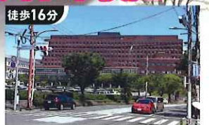
徒歩16分 産業医科大学