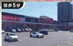
徒歩5分 ハローデイ共立大前店